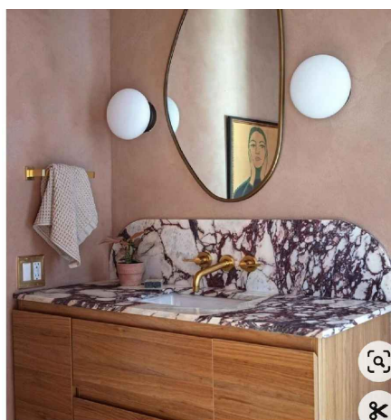
PRZYKŁAD WYKOŃCZENIA BLATÓW

ZLEWOZMYWAK FRANKE BLISS BSG 611-78 GRANITOWY CAPPUCCINO